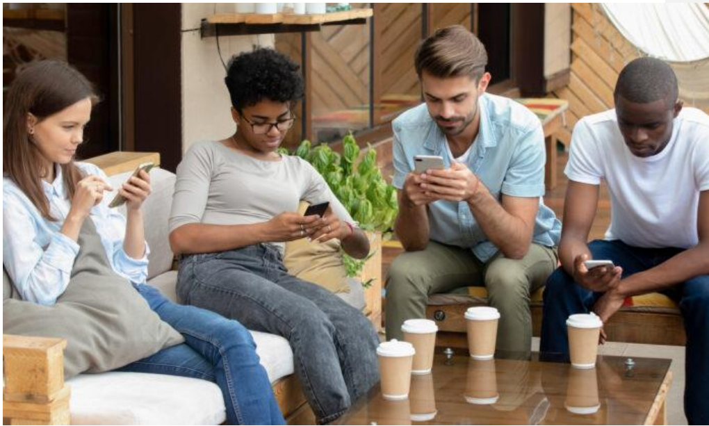
Photo : L'impact croissant des téléphones intelligents sur les relations humaines modernes par SHANNON ROBERTS, 9 juillet 2020, consulté en ligne le 31 mai 2021 à 11H50.

Cependant, ce nouveau langage ne se limite pas seulement entre les hommes et les machines, mais s'étend aussi jusqu'aux hommes sous forme d'action de transmission. En effet, la machine est devenue un intermédiaire dans la communication interhumaines et de ce fait dans leur relation. Par exemple, deux personnes qui devraient se rencontrer pour discuter de quelque chose, préfèrent échanger à travers les machines mises au point par les technologies numériques. Le langage et les relations de proximité perdent ainsi leur valeur au grand profit des appareils numériques.