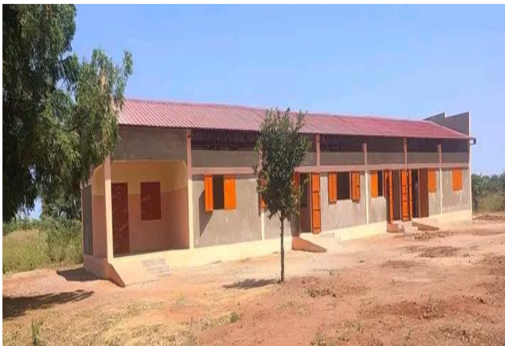
Image 9: photo d'un bâtiment scolaire, réalisé par World Vision à Bologo dans le Tandjilé.