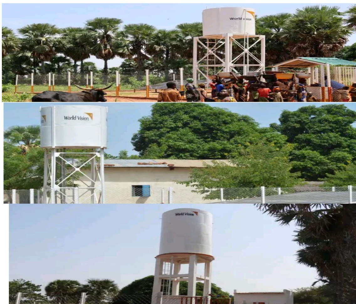
Image 5: Trois mini-adductions réalisées par World Vision à Dobara, Bessoum et Dogoininga dans la région du Logone Occidental