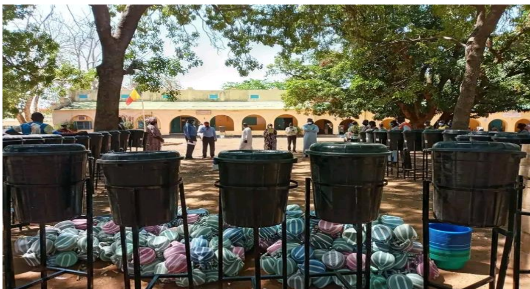
Image 3: Différents matériels de lutte contre la Covid-19 offerts par la World Vision dans le Logone Occidental.