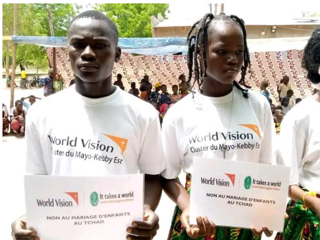
Image 6: 20 mai 2022, célébration de la journée de lutte contre le mariage des enfants