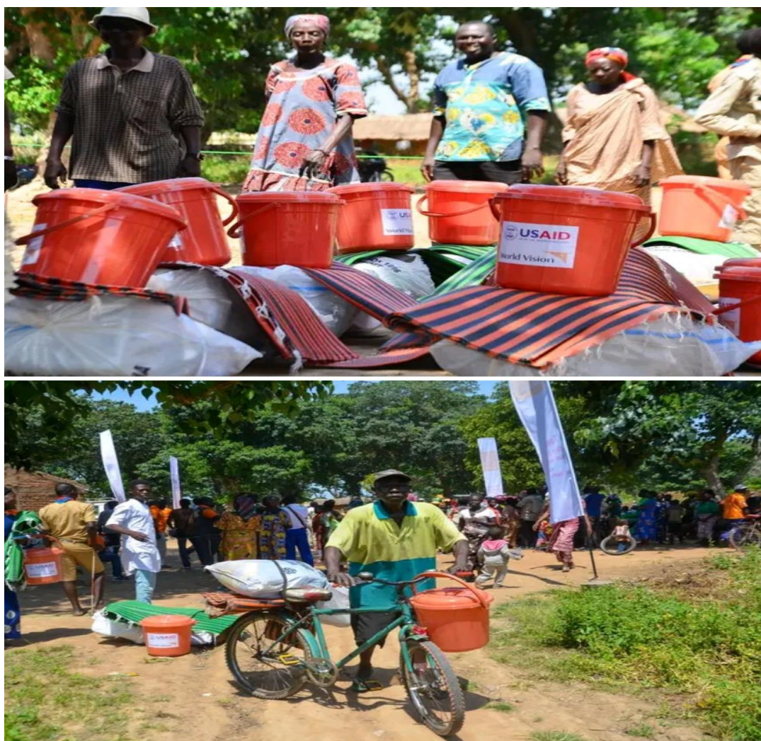
Image 2: Remise des kits aux sinistrés de Moundou, chef-lieu de la région du Logone Occidental par World Vision 2022.