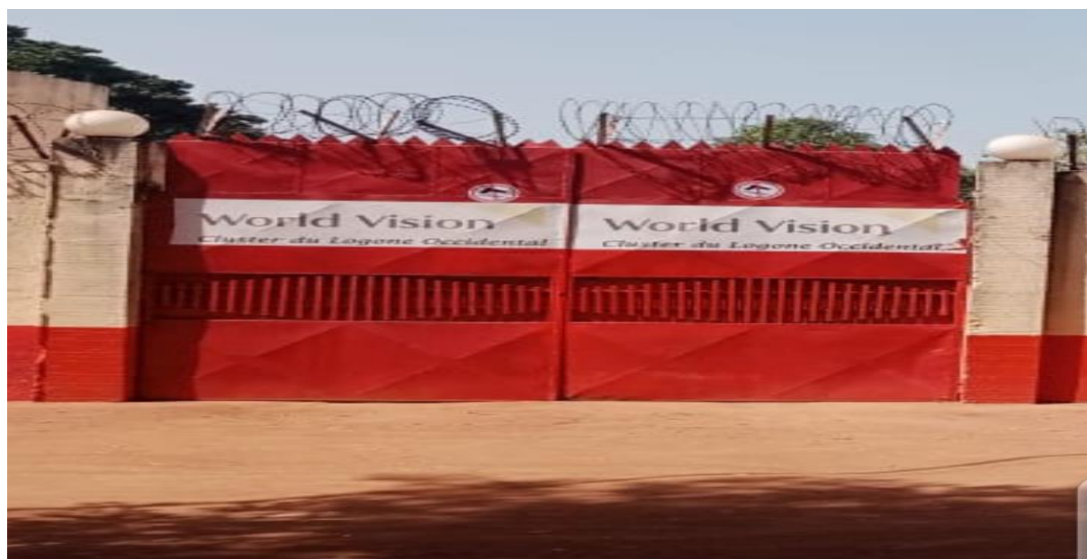
Image 7: Image de la base principale de World Vision dans la région du Logone Occidental.