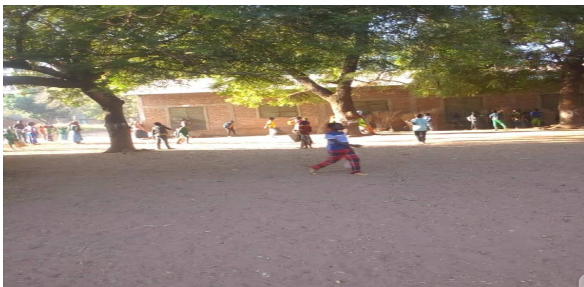
Image 4: Bâtiments de l'école officielle de Badeye, réalisés par World Vision