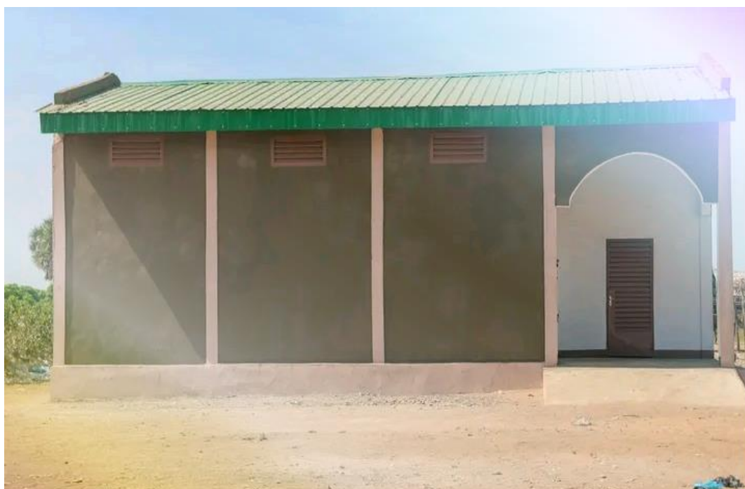
image 8: Image du magasin de stockage réalisé à Dodinda par World Vision et IHDL Tchad à travers le projet PROSECA.

Source : cliché Togonan Aubin, photo prise à Dodinda le 17 décembre, 2023