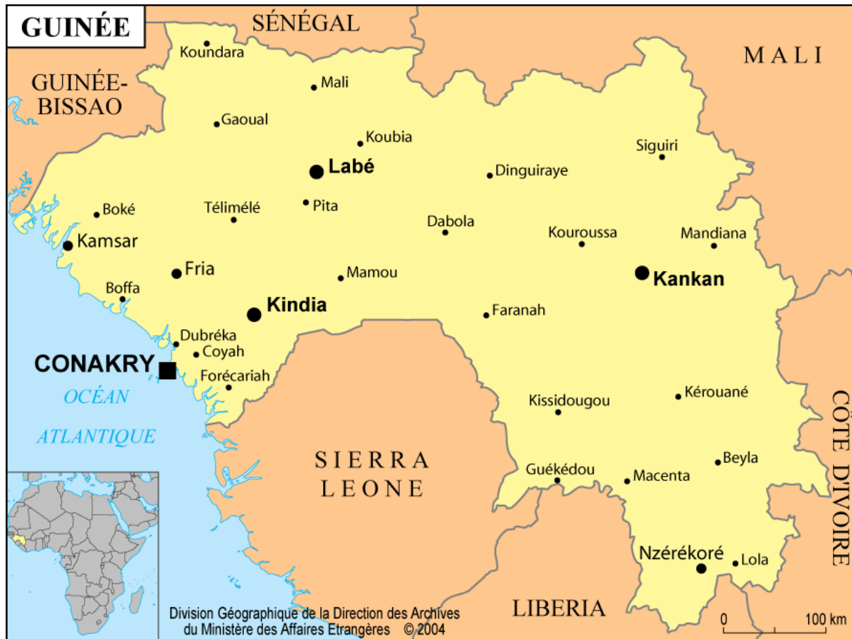
Figure 1 Carte de la République de Guinée.