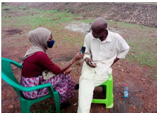
Figure 1 Interview avec un acteur du cinéma en Guinée