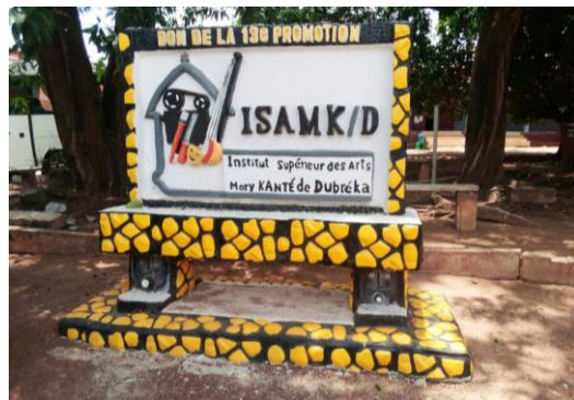
Figure 2 Visite à l'ISAMK de Dubréka