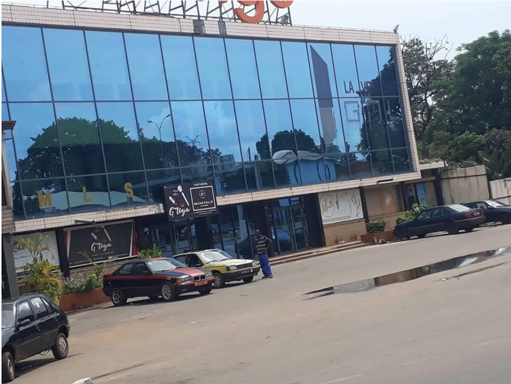
Figure 2 Un complexe de loisirs en lieu et place du cinéma liberté à Kaloum.

L'arrivée des postes téléviseurs dans les foyers et l'utilisation des lecteurs CD et DVD n'ont pas aidé à améliorer la situation des producteurs cinématographiques. L'arrivée par la suite des chaînes à dimension internationale (Canal+, Soditev) qui offraient des variétés particulièrement appréciées des consommateurs guinéens a presque définitivement scellé le sort de la production locale. Il restait la télévision nationale guinéenne (RTG) qui diffusait les productions en langues locales après le journal télévisé