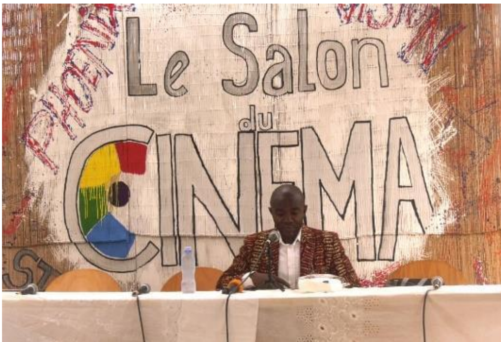
Figure 3 Première édition du Salon du cinéma en Guinée.

Un autre objectif que se fixe désormais ces jeunes, c'est de changer la donne et encourager la couche féminine à se tourner vers l'industrie cinématographique. Une initiative qui trouve tout son sens au moment où ces dernières constituent une pièce maîtresse dans la réalisation d'un film.