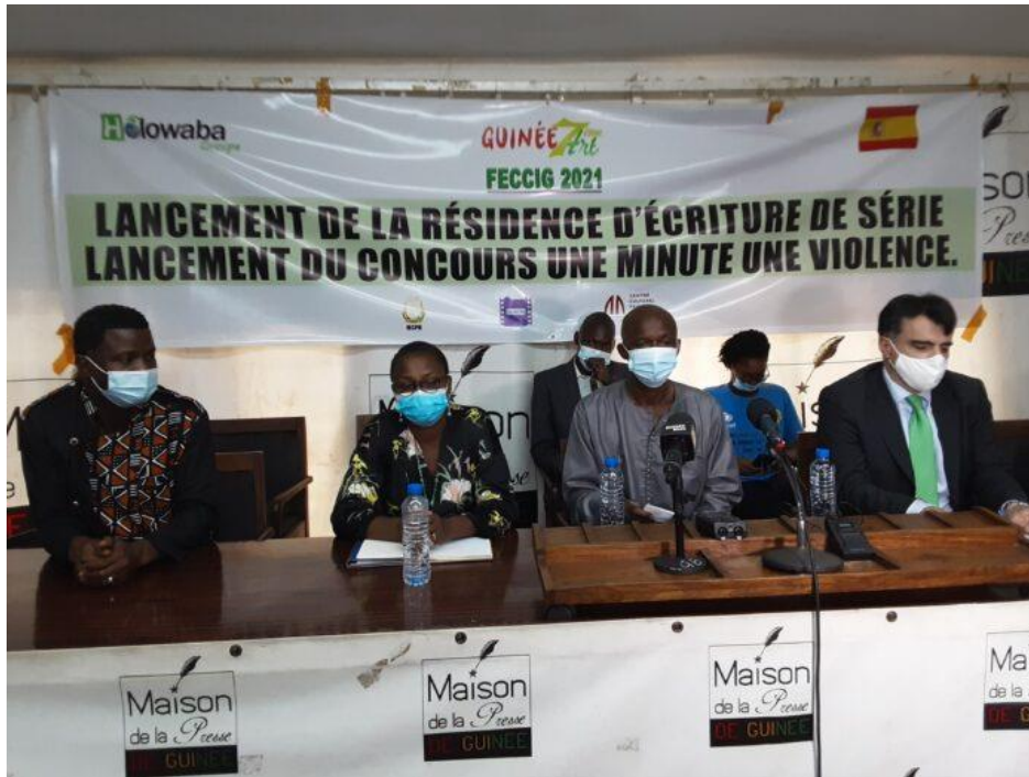
Figure 4 Lancement de la huitième édition du FECCIG.